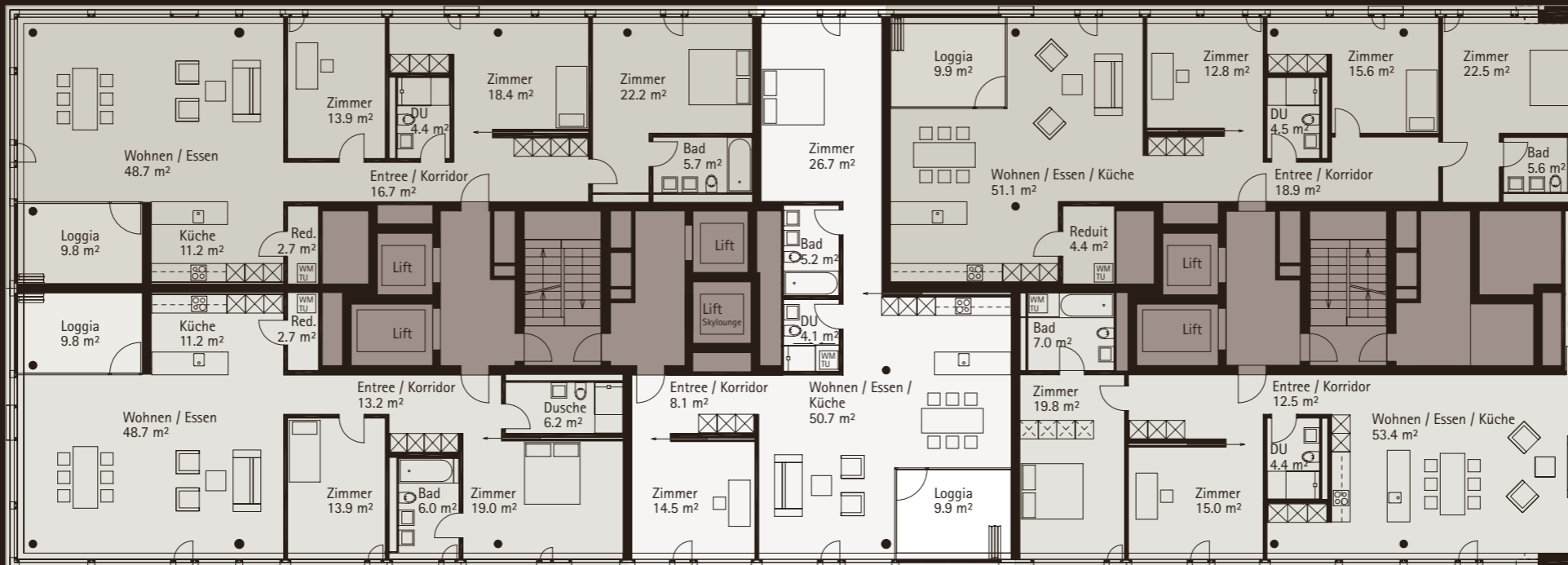
WOHNUNG 02.1602, 4½-ZIMMER NGF: 135.3 m², Loggia: 9.9 m²