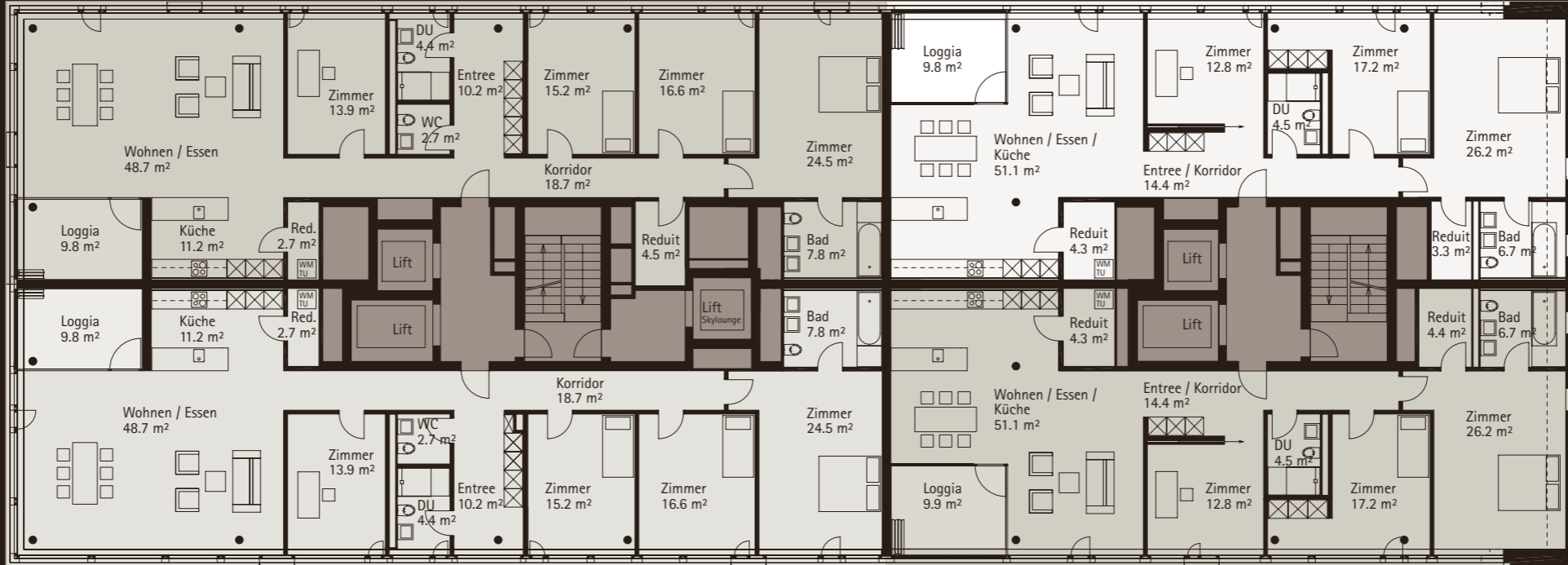
WOHNUNG 02.1702, 4½-ZIMMER NGF: 140.4 m², Loggia: 9.8 m²