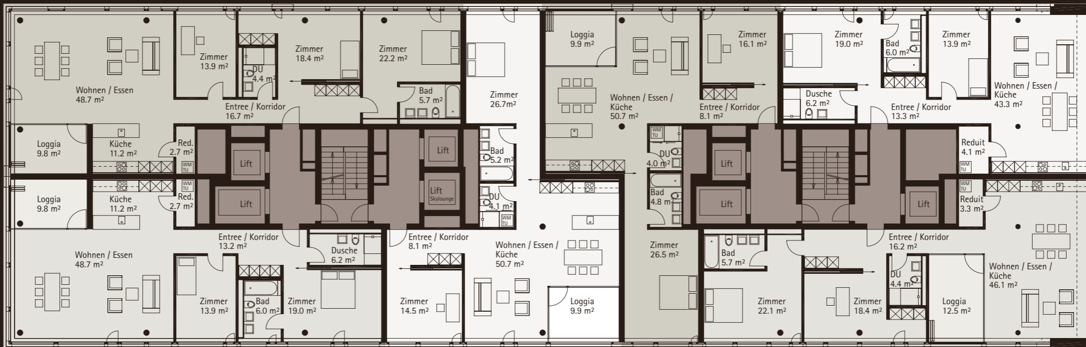
WOHNUNG 02.1103, 3 1/2-ZIMMER NGF: 105.6 m 2