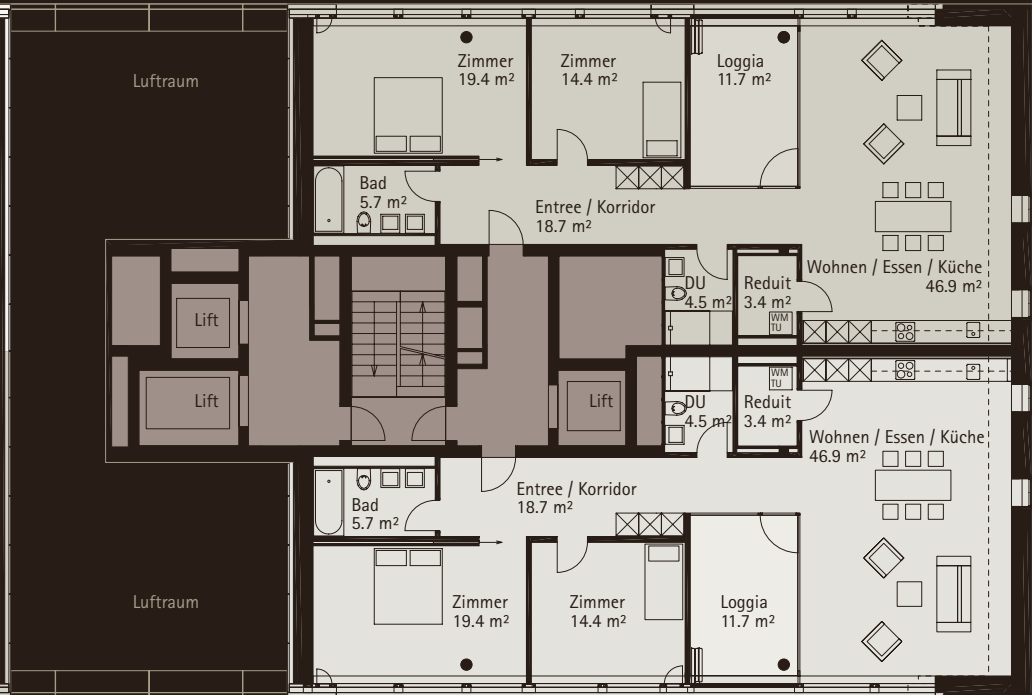
WOHNUNG 02.0902, 3 1/2-ZIMMER NGF: 113.4 m 2 , Loggia: 11.7 m 2