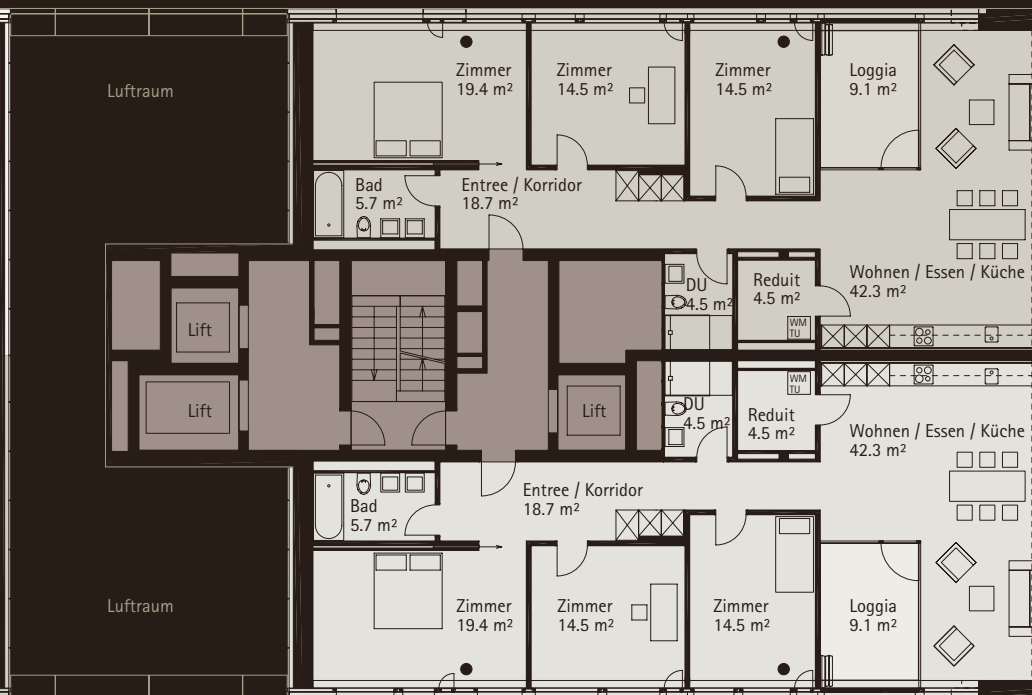
WOHNUNG 02.0802, 4 1/2-ZIMMER NGF: 124.6 m 2 , Loggia: 9.1 m 2