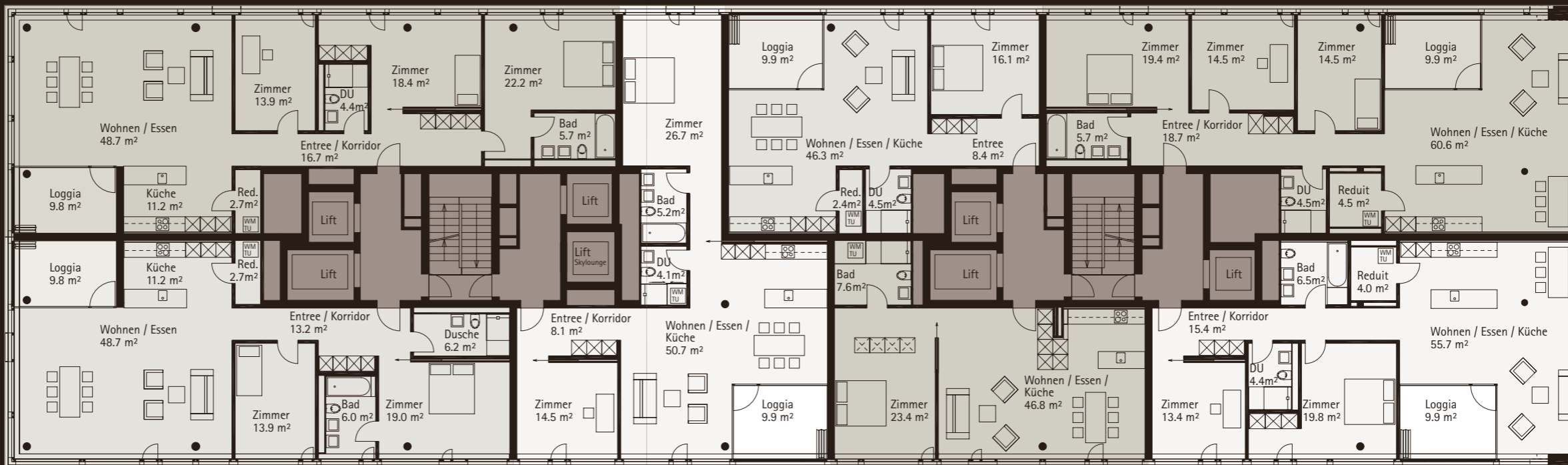
WOHNUNG 02.0604, 4½-ZIMMER NGF: 143.0 m², Loggia: 9.9 m²